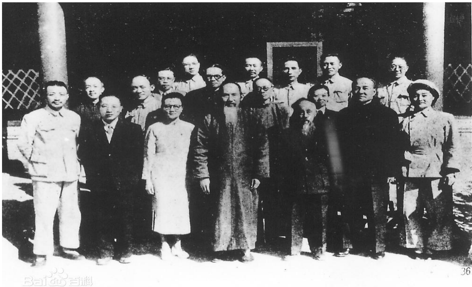
1949年9月参加新政协会议民盟代表合影